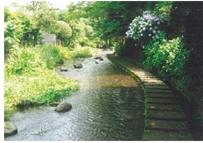
写真-4 源兵衛川沿いの人と水の交流空間

ところで、三島市ではこのような行政主導の水に対する働きとともに市民が主体となった取り組みが地域の特色になっています。三島ゆうすい会、1992年に誕生したNP0法人グラウンドワーク三島などがその中心です。グラウンドワーク三島は2005年に、朝日新聞主催の環境分野で優れた活動をしている団体に与えられる「明日への環境賞」(第7回)が授与されました。ゴミ捨て場のように悪化していた源兵衛川の水環境を蘇生させて水辺の遊歩道を設置したり、三島梅花藻 2) を復活させ新しい水環境を創造させるなどの実践活動がその対象でした。地域の宝物でもある地下水や湧水などの水環境をもとに、新しい時代の親水思想を定着させ、都市景観を創造させた水の都・三島の地域再生はひとつの範となるでしょう。