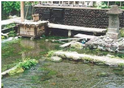
写真-5 三島梅花藻の里と水神

ところで、三島市ではこのような行政主導の水に対する働きとともに市民が主体となった取り組みが地域の特色になっています。三島ゆうすい会、1992年に誕生したNP0法人グラウンドワーク三島などがその中心です。グラウンドワーク三島は2005年に、朝日新聞主催の環境分野で優れた活動をしている団体に与えられる「明日への環境賞」(第7回)が授与されました。ゴミ捨て場のように悪化していた源兵衛川の水環境を蘇生させて水辺の遊歩道を設置したり、三島梅花藻 2) を復活させ新しい水環境を創造させるなどの実践活動がその対象でした。地域の宝物でもある地下水や湧水などの水環境をもとに、新しい時代の親水思想を定着させ、都市景観を創造させた水の都・三島の地域再生はひとつの範となるでしょう。