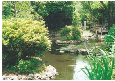
写真-3 源兵衛川沿いの水の苑緑地