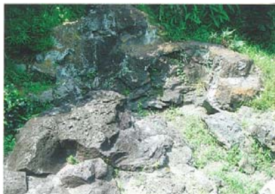
写真-1 湧水が涸渇し溶岩のみの鏡池

静岡県三島市は東海道の宿場町、源頼朝ゆかりの三島大社門前町などで有名ですが、豊かな水の景観に恵まれた水の都としてもその名を馳せてきました。それは、新富士火山の活動によって噴出した溶岩流が箱根火山との裾合谷(すそあいだに)を南方に流下し、三島市周辺まで達しているのですが、この溶岩のなかに湛えられた地下水やその露頭である湧水がさまざまな水風景や水的话题を提供してきました。