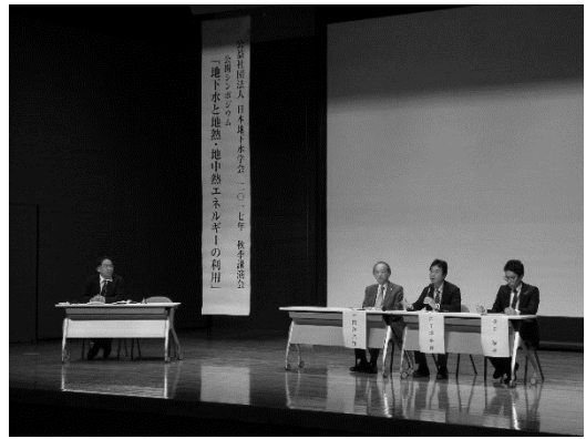
シンポジウムの様子（パネルディスカッション）