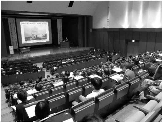
シンポジウムの様子（招待講演）