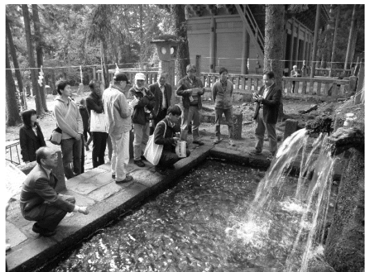
現地見学会の様子（岩木山神社湧水）